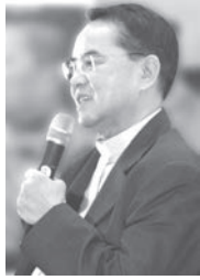
บ.สันติสุข